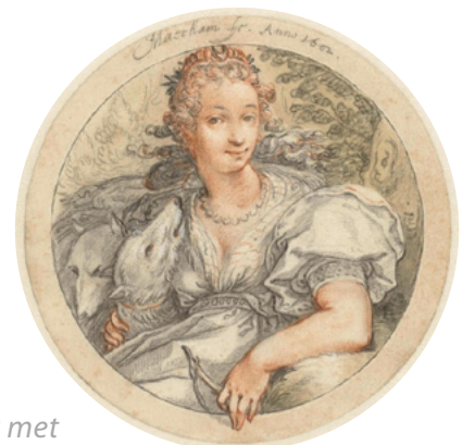
Jacob Matham, Kracht (jurk met smalt en azuriet)