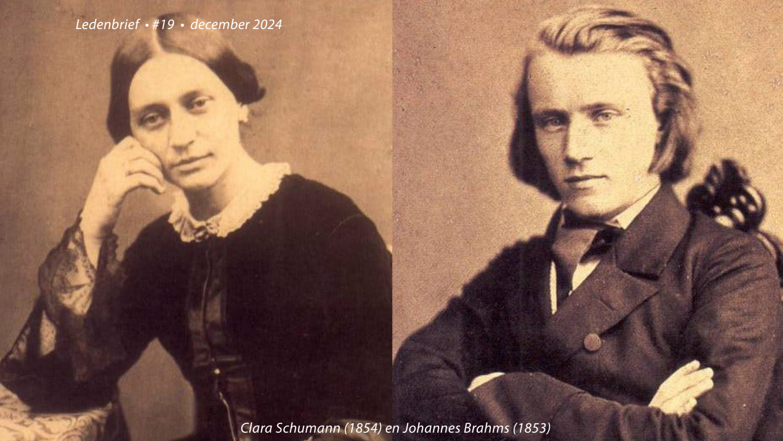
Clara Schumann (1854) en Johannes Brahms (1853)