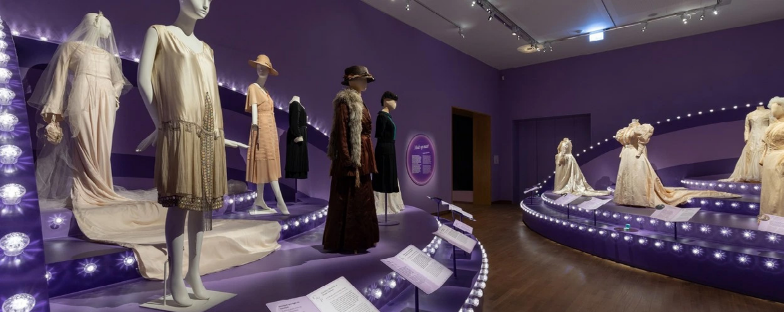
'Ja, ik wil'