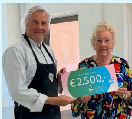
Overhandiging van de cheque op 19 september 2024