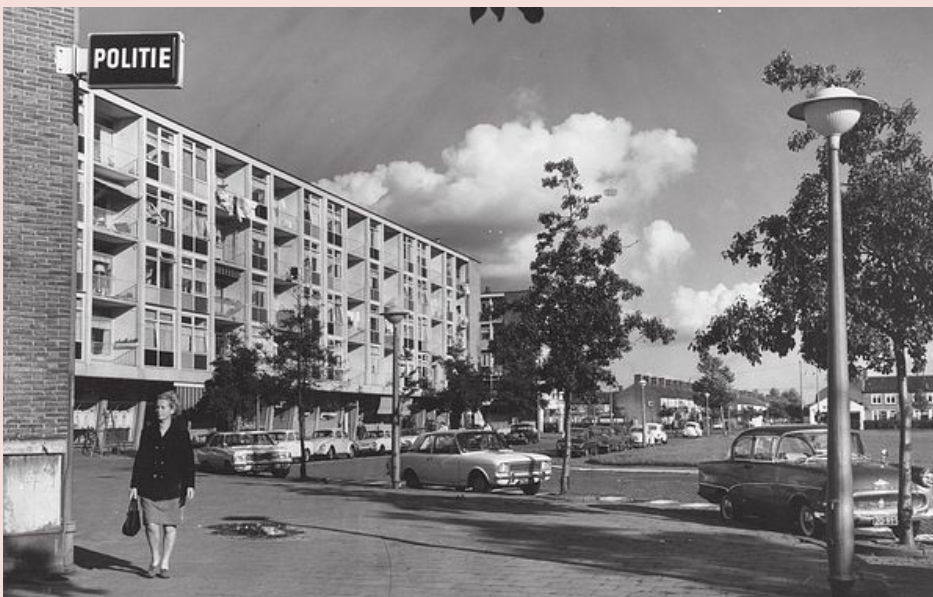
Foto illustratief, met toevallige passant

Bij haar overlijden in 1999 is de eerste vrouwelijke politiecommissaris nagenoeg vergeten: op een bericht in het korpsblad na.